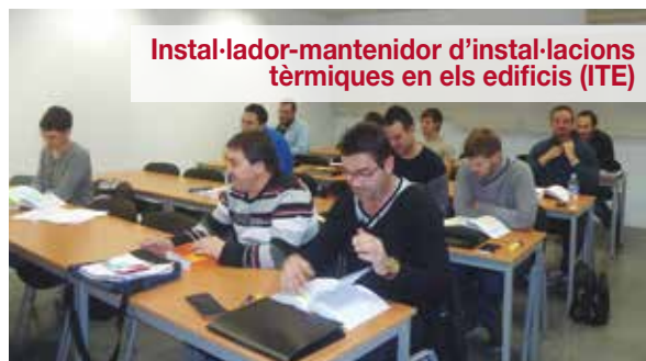
Instal·lador-mantenidor d'instal·lacions tèrmiques en els edificis (ITE)