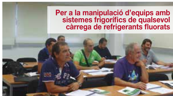
Per a la manipulació d'equips amb sistemes frigorífics de qualsevol càrrega de refrigerants fluorats

Formació per a l'obtenció de carnets i acreditació de les competències professionals