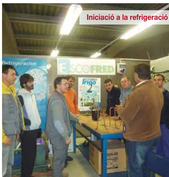
Iniciació a la refrigeració