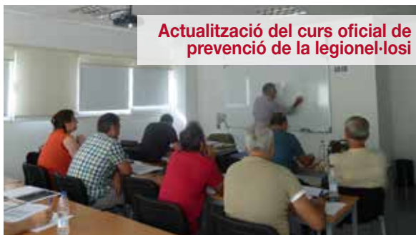
Actualització del curs oficial de prevenció de la legionel·losi

“ Homologat per la Direcció General de Planificació i Recerca en Salut de la Generalitat de Catalunya. ”