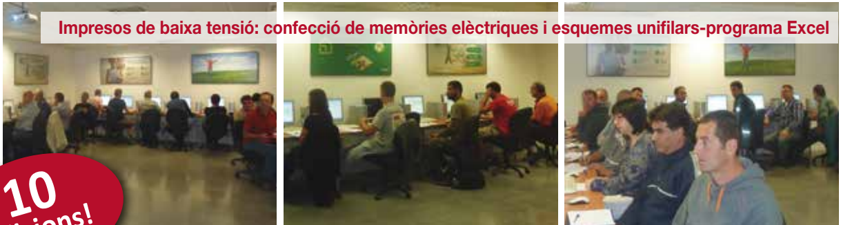
Impresos de baixa tensió: confecció de memòries elèctriques i esquemes unifilars-programa Excel