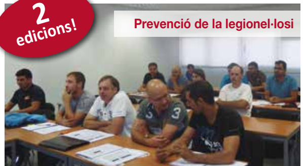
Prevenció de la legionel·losi