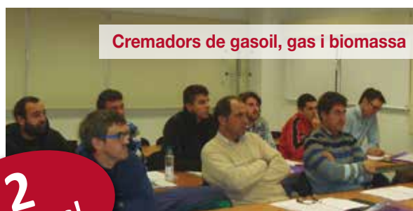
Cremadors de gasoil, gas i biomassa