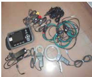
Analitzador de xarxa

Qualsevol agremiat que vulgui accedir a aquest servei pot posar-se en contacte amb el CETIG i identificar-se com a agremiat.