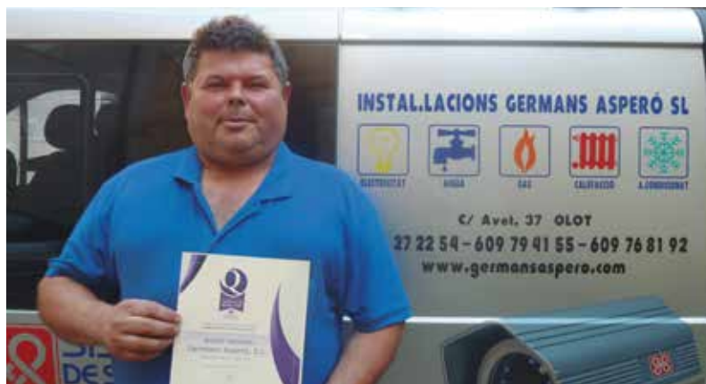
Instal·lacions Germans Asperó SL, d'Olot

L'obtenció del distintiu suposa un reconeixement per a l'empresa que l'obté i una garantia per als seus clients. La iniciativa està dissenyada per mantenir de forma continuada uns paràmetres òptims de qualitat del servei, garantint-ne l'eficàcia i considerant en tot moment les necessitats i la satisfacció del client.