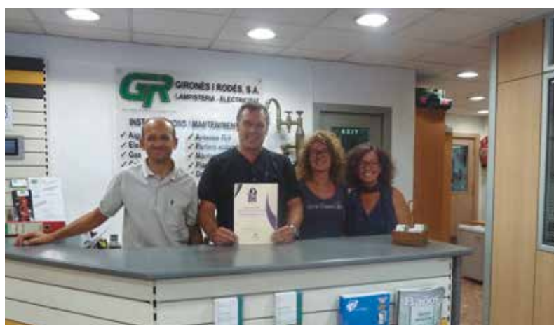
Gironès i Rodés SA, de Blanes