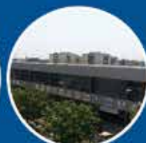
PINEDA DE MAR