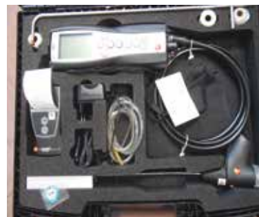
Analitzador de combustió