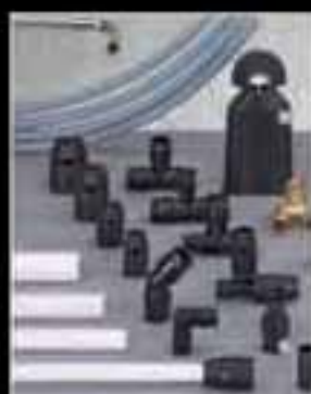
Sistema iFIT Pb, Multicapa, Pex El sistema más moderno, rápido versátil y económico del mercado