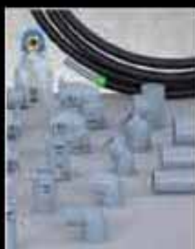
Sistema Installex Pb para grandes instalaciones Rápido y seguro de montar