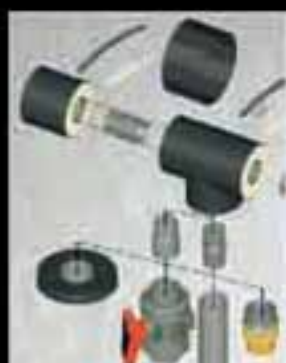
Coolfit -ABS La máxima eficiencia en climatización y refrigeración