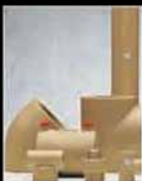
Sistema Aquasystem PP-c La fiabilidad de lo tradicional