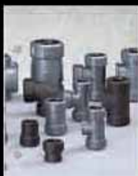
Sistema Primofit El complemento ideal