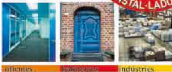
oficines residències indústries

Seguretat per a les empreses. Per a les persones >>